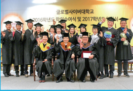
졸업식 및 입학식 (매년 3월)