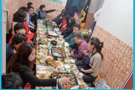
지역모임 실시 (수시)