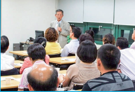
전문가 특강 (수시)