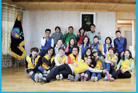
정기 MT 실시 (매년 3월 · 10월)