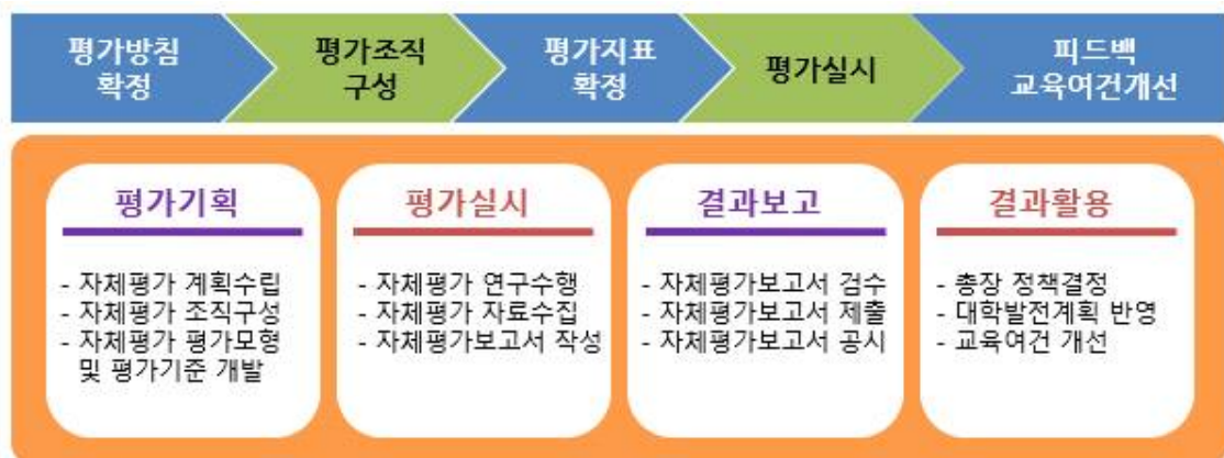
[ 자체평가 추진 절차 ]

평가실시 단계에서는 평가영역별 추진계획 수립, 각 영역별 연구수행, 자료 수집, 결과보고서 작성 및 검수 등이 이루어졌다.